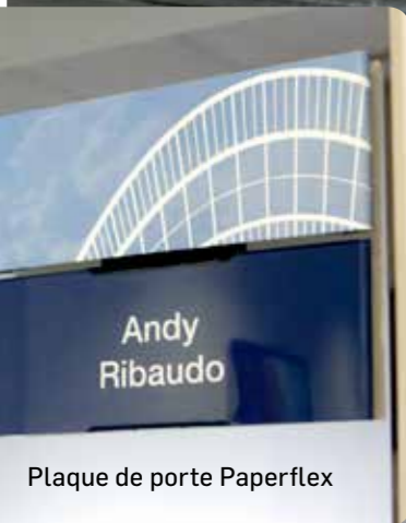
Plaque de porte Paperflex