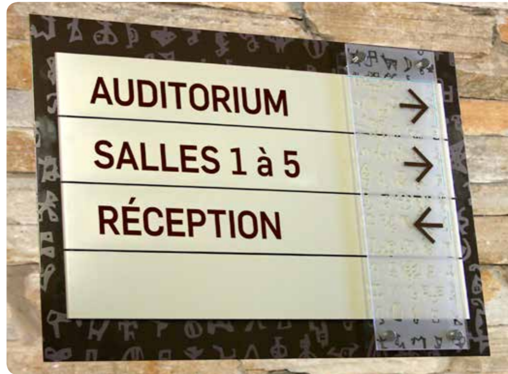
Panneau directionnel à lames amovibles