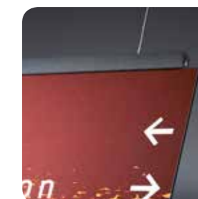
Macer Glass en drapeau