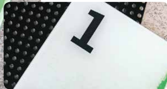
Grille de support

Infinity peut aussi être utilisé sans la grille de support mais avec une entretoise et des clips de fixation plus économiques (voir Infinity Basic). Si vous désirez quelque chose de plus « exclusif », pourquoi ne pas imaginer votre propre système et choisir des matériaux originaux ? Le système Infinity permet de conserver les qualités d'un système modulaire à part entière. La technologie « print on panel » est le complément idéal dans ce cas : ce système d'impression directe numérique permet l'impression de toutes les couleurs, y compris le blanc, et assure un total respect de votre projet graphique.