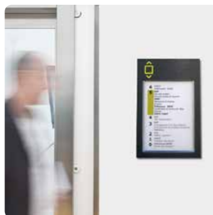
Infinity Basic Paperflex