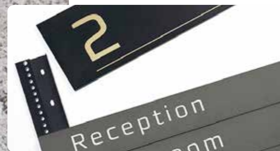
Rails de support